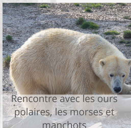
Rencontre avec les ours polaires, les morses et manchots