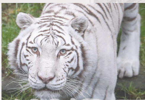
Visite découverte du Royaume de Ganesh et de la faune d'Asie