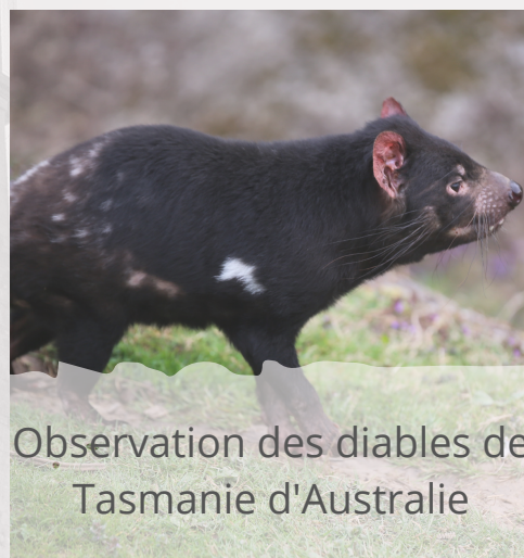
Observation des diables de Tasmanie d'Australie