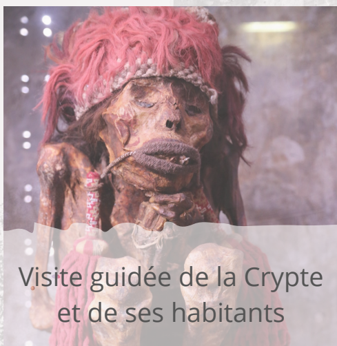
Visite guidée de la Crypte et de ses habitants